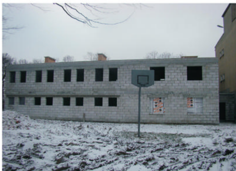
Na zdjęciu: Budowa sali gimnastycznej przy MZS w Raciążu