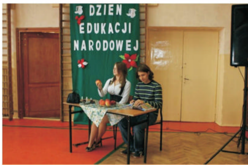
Na zdjęciu: Przedstawienie z okazji Dnia Edukacji Narodowej