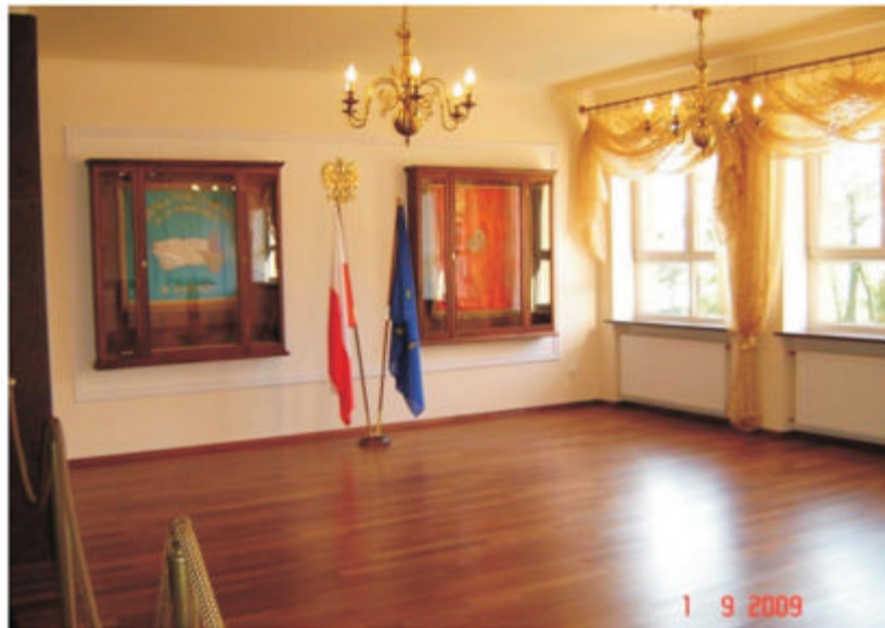
Na zdjęciu: Sala reprezentacyjna MZS w Raciążu

W okresie wakacyjnym remontowane były: korytarz na I piętrze, wymieniono instalacje i oprawy elektryczne, pomalowano ściany i lamperie, oznakowano drogi ewakuacyjne. Na sali gimnastycznej cyklinowano i lakierowano podłogi. Na holach zabudowywane są kaloryfery. Wymieniono dwoje drzwi wejściowych do budynku głównego. We wszystkich budynkach dokonano drobnych napraw budowlano-malarskich, dekarских. Zainstalowano ciepłą wodę w łazienkach. Wyposażono 4 sale lekcyjne w nowe ławki, krzesła i mebleścianki, w innych wymieniane są blaty ławek szkolnych. Doposażono w nowe pomoce dydaktyczne nauczycieli wychowania fizycznego. Wyposażona jest pracownia biologiczna w gimnazjum. Nauczyciele edukacji wczesnoszkolnej otrzymali laptopy. Przygotowano salę reprezentacyjną w której wystawiono sztandary szkolne, insygnia państwowe.