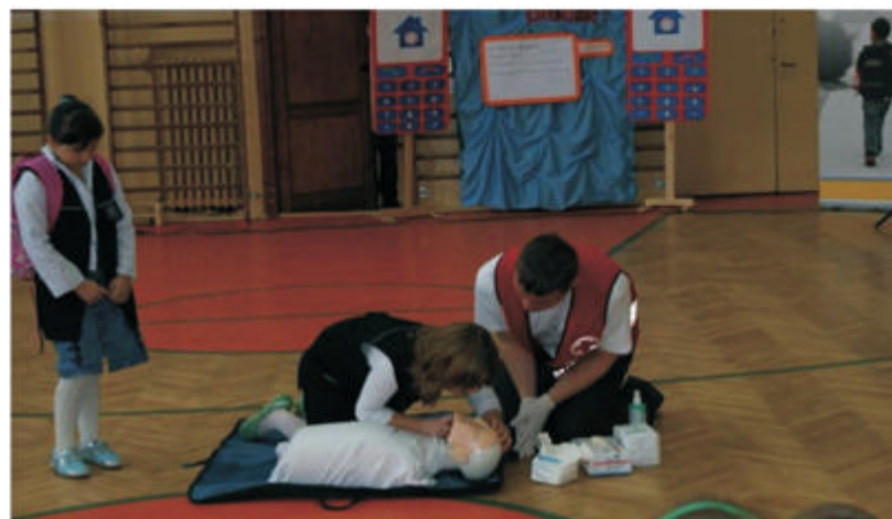
Na zdjęciu: nauka udzielania pierwszej pomocy