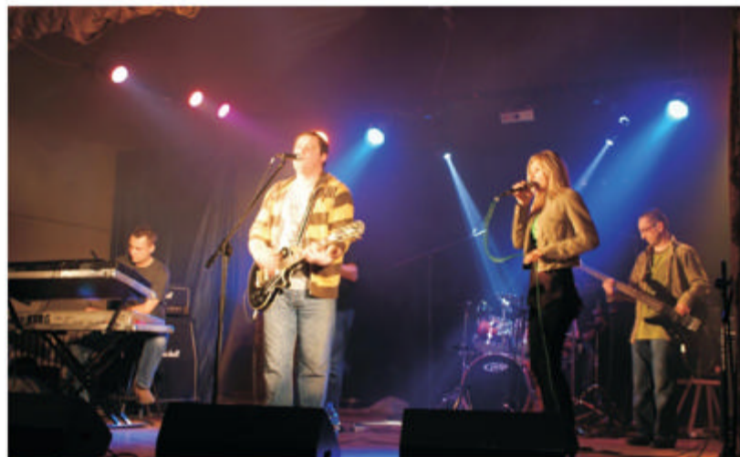
Na zdjęciu: zespół SUNFLOWERS