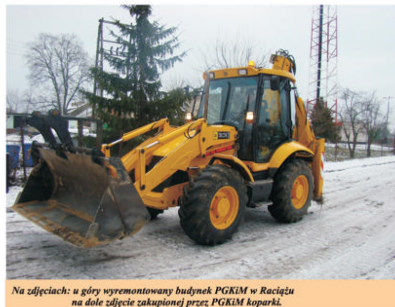
Na zdjęciach: u góry wyremontowany budynek PGKiM w Raciażu na dole zdjęcie zakupionej przez PGKiM koparki.