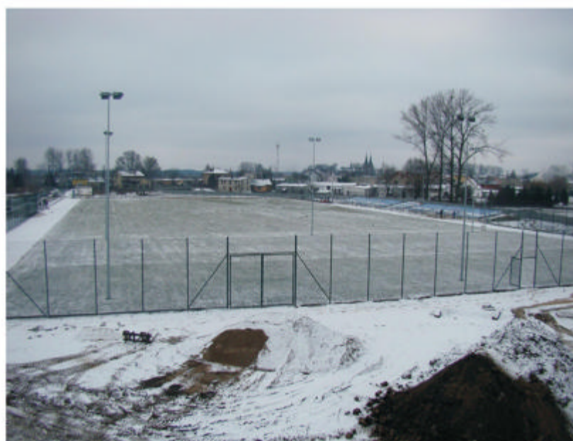
Na zdjęciu: Prace modernizacyjne na obiekcie Stadionu miejskiego