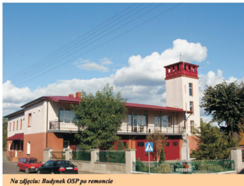
Na zdjęciu: Budynek OSP po remoncie