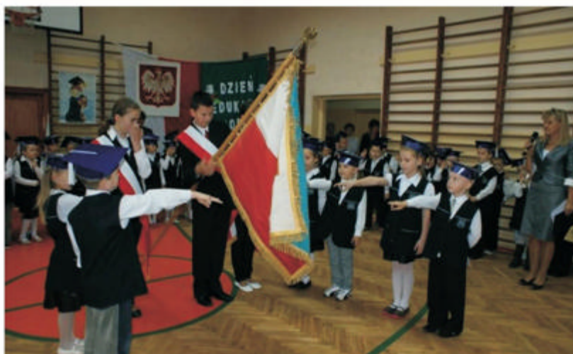
Na zdjęciu: Pasowanie na ucznia

W dniu Święta szkolnego przyjęliśmy Ślubowanie od uczniów klas pierwszych szkoły podstawowej i gimnazjum.