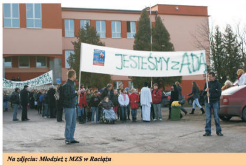
Na zdjęciu: Młodzież z MZS w Raciążu