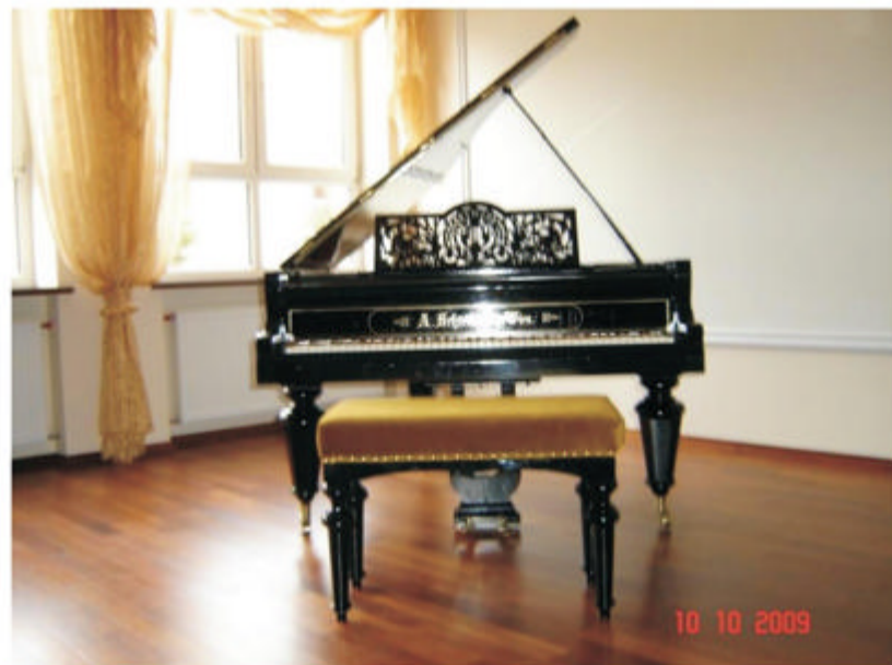
Na zdjęciu: odrestaurowany fortepian

W niej znajdują się również kroniki szkolne oraz kronika Rady Rodziców, które ukazują życie szkolne przeszłe i teraźniejsze. Jasność sali podkreślają świeczniki z okresu Księstwa Warszawskiego. Splendoru tej sali dostarcza restaurowany fortepian.