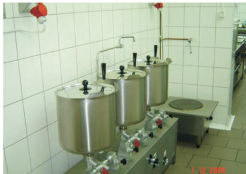
Na zdjęciu: Wyremontowana kuchnia w MZS w Raciążu