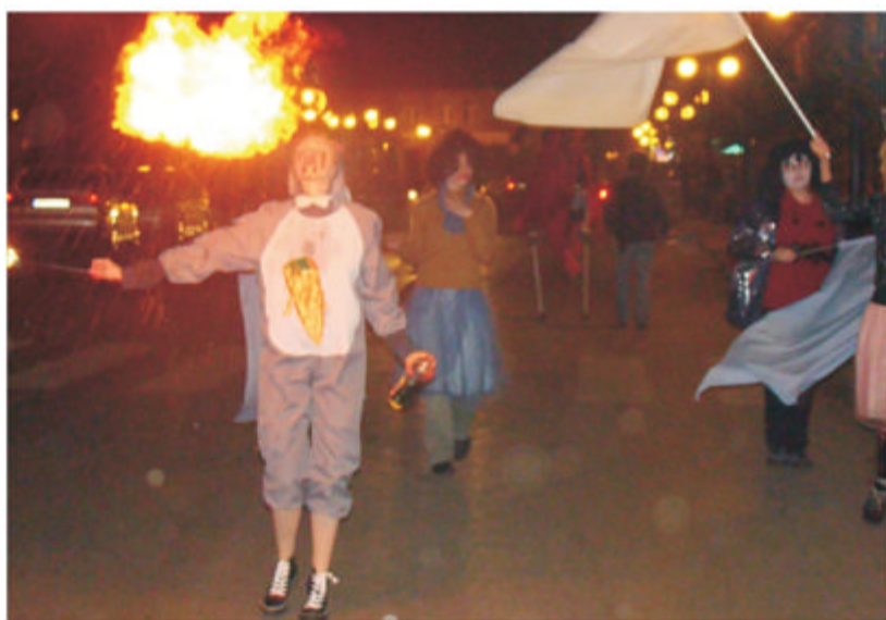
Na zdjęciu: członkowie grupy teatralnej "Przymat"

30 i 31 października odbyły się warsztaty teatralne dla młodzieży z grupy teatralnej działającej przy MCKSiR. Poprowadzili je artyści z Mika-Art. Podczas warsztatów młodzież uczyła się m.in. chodzenia na szczydach, płucia ogniem. Następnie młodzi artyści tworząc kolorowy korowód zaprezentowali swoje umiejętności na ulicach miasta.