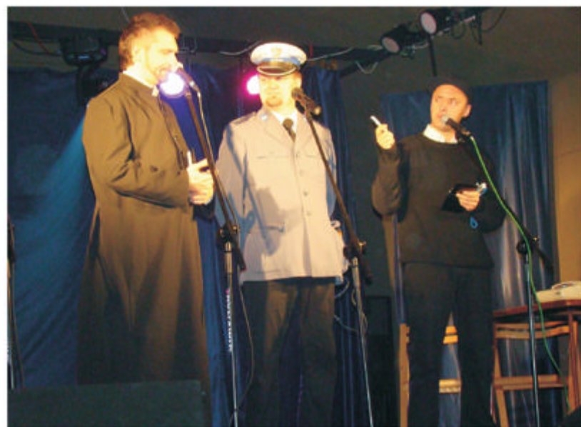
Na zdjęciu: członkowie Kabaretu Młodych Panów