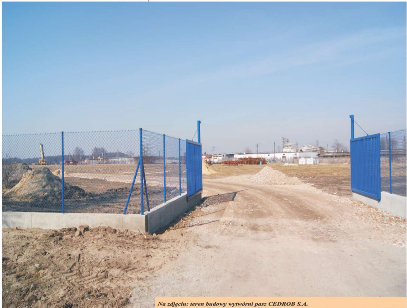
Na zdjęciu: teren budowy wytwórni pasz CEDROB S.A.

Stosownie do art. 64 ust.1 i 2 ustawy z dnia 3 października 2008 r. o udostępnianiu informacji o środowisku i jego ochronie, udziale