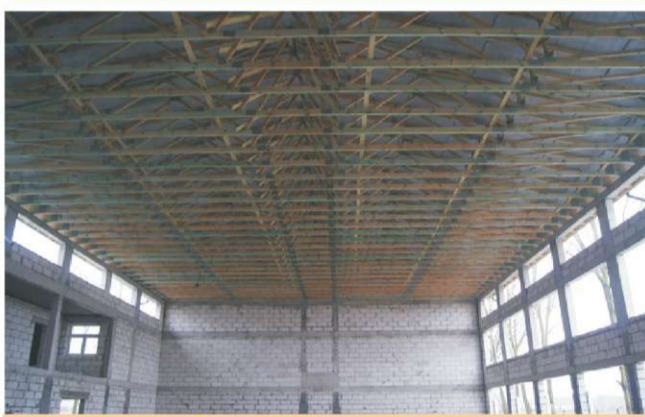
Na zdjęciu: zadana Hala Sportowa MZS w Raciążu