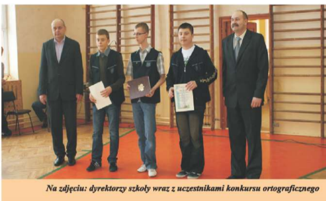
Na zdjęciu: dyrektorzy szkoły wraz z uczestnikami konkursu ortograficznego