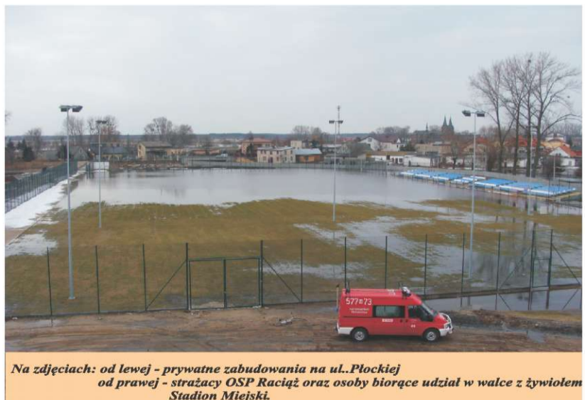
Na zdjęciach: od lewej - prywatne zabudowania na ul. Płockiej od prawej - strażacy OSP Raciąż oraz osoby biorące udział w walce z żywiołem Stadion Miejski.