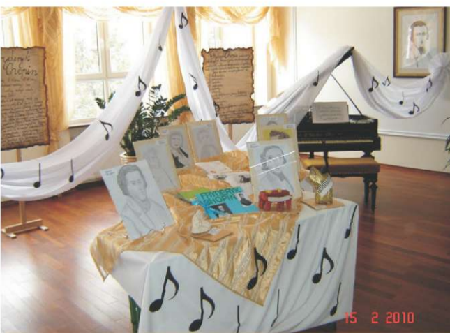
Na zdjęciu: Ekspozycja na sali reprezentacyjnej szkoły