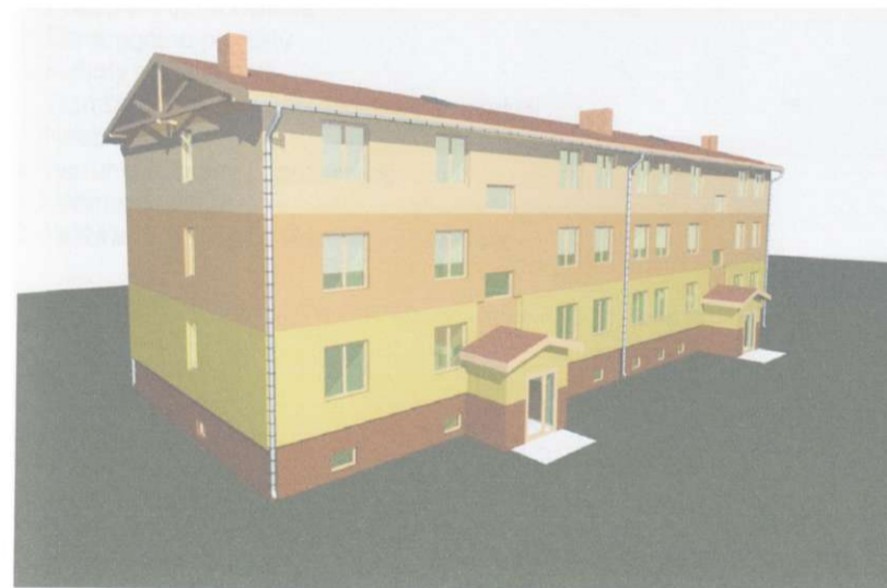
Na zdjęciu: Projekt budynku przy ul. Akacjowej

ogłoszony zostanie przetarg celem wywołania wykonawcy. Budowa bloku w którym będą 24 lokale mieszkalne w pewnym stopniu rozwiąże nabrzmiały problem niedoboru mieszkań komunalnych.