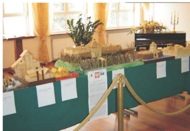
Na zdjęciu: makiety wykonane przez - Marcina Pośpiecha, Macieja Bednarskiego, Adriana Janiszewskiego, Aleksandrę Sadowską, Krzysztofa Lorenca, Macieja Wawrzyniaka, Kubę Kornackiego.

Można już powiedzieć, że została ukończona praca nad szkolną stroną www. Tam można więcej zdobyć informacji o życiu naszych szkół. Zapraszamy pod adresem http://mzsraciaz.edupage.org